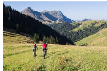
Région des Paccots