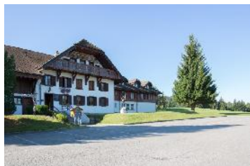
Chalet-Restaurant des Colombettes

Début de l'«aventure» à Vuadens, précisément au Chalet-Restaurant des Colombettes. Cap sur la colline du Gibloux : magnifique vue sur le lac de la Gruyère, le Moléson et la chaîne des Vanils. Passage sur la rive droite du lac de la Gruyère via le barrage de Rossens avant d'attaquer le « plat de résistance » : la montée à la Berra par une superbe traversée panoramique et un final en mode DH !