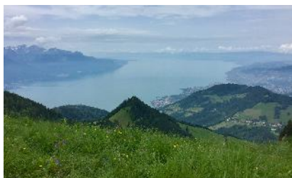
... et vue sur le Léman