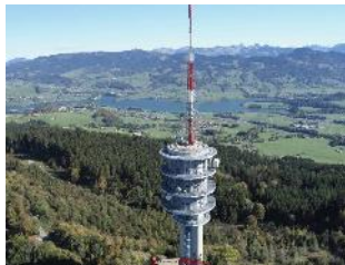
Gibloux avec son antenne