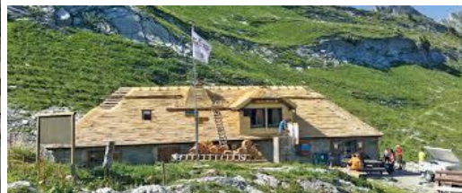
Sur le chemin du Plateau de Corjon