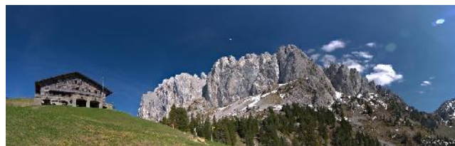
Chalet du Soldat et les Gastlosen