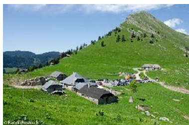
Col de Jaman

Final en mode « dessert » avec une dernière descente ludique sur Vuadens (les Colombettes).